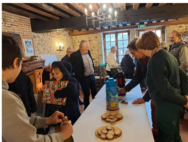
Culte de Noel 21-12-2025

De nombreux paroissiens ont répondu favorablement à notre appel aux dons de décembre et ont fait preuve d'une grande générosité ! Nous vous en sommes très reconnaissants, car vous savez que notre église ne peut exister que grâce à vos dons. Avez-vous oublié de faire un don supplémentaire ou n'avez-vous pas encore eu le temps ? Bonne nouvelle : vous pouvez encore faire un don à notre église en 2026.