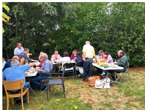
Le repas après le culte