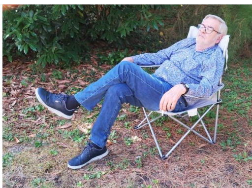
Le siesta après le repas