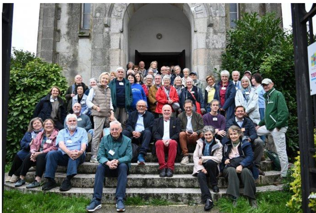
Demi groupe devant le temple du Creusot