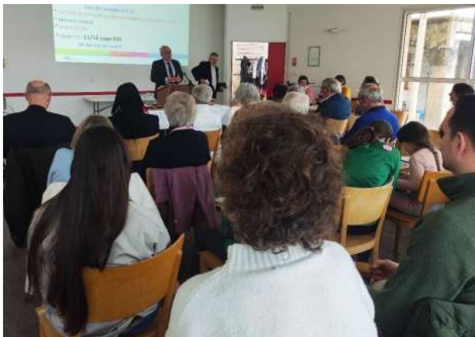
24 mars : le culte et l'AG

Ces études bibliques sont indépendantes les unes des autres même si elles traitent de la même thématique. Vous pouvez donc aisément venir rejoindre ce groupe à n'importe quelle séance sans a priori.